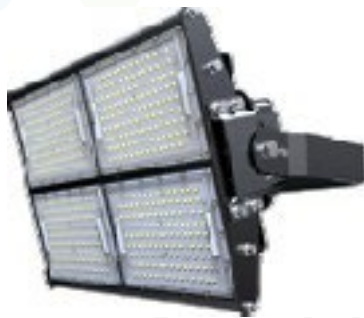
PC Lens 60x100°